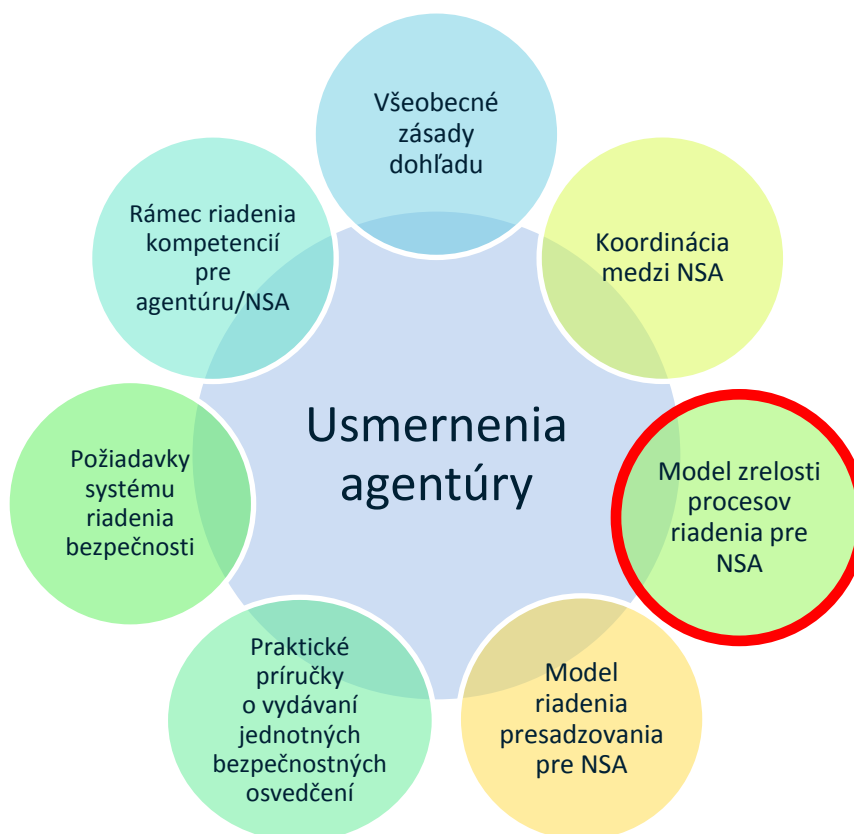
Obrázok 1: Súhrn usmernení agentúry

V modeli zrelosti procesov riadenia od agentúry sa používa rovnaká základná štruktúra ako v prílohe I a II k delegovanému nariadeniu Komisie (EÚ) 2018/762 [ spoločné bezpečnostné metódy systému riadenia bezpečnosti ] na vytvorenie stanoviska ku kvalite SMS organizácie. Tri riadky požiadaviek sú mierne odlišné, aby vyhovovali verzii nástroja v mobilnej aplikácii, avšak zámer za každou požiadavkou medzi modelom zrelosti a požiadavkami SMS zostáva rovnaký. Plní aj potrebu NSA týkajúcu sa nástroja, ktorý sa môže používať na splnenie požiadaviek stanovených v článku 7 ods. 1 delegovaného nariadenia Komisie (EÚ) 2018/761 na hodnotenie účinnosti SMS a článku 5 ods. 2 uvedeného nariadenia na hodnotenie výkonnosti riadenia bezpečnosti železničného podniku alebo manažéra infraštruktúry. Cieľom prístupu nariadeného v článku 5 ods. 2 je vytvoriť silnú väzbu medzi posúdením a následným dohľadom, čím sa uľahčuje lepšia výmena informácií v rámci NSA a medzi NSA a agentúrou (t. j. medzi subjektmi vykonávajúcimi dohľad a subjektmi vykonávajúcimi posúdenie) a nakoniec, lepšie sa objasňuje železničnému sektoru, ako jeho vlastná výkonnosť v oblasti bezpečnosti tvorí vstup pre dohľad NSA (napr. určenie priorit činností dohľadu v oblastiach s najväčším rizikom pre bezpečnosť).